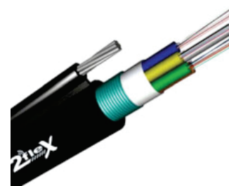
Cabo Óptico FIG 8