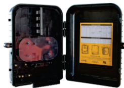
CTO - Caixa de Terminação Óptica cód.: 6.08.054