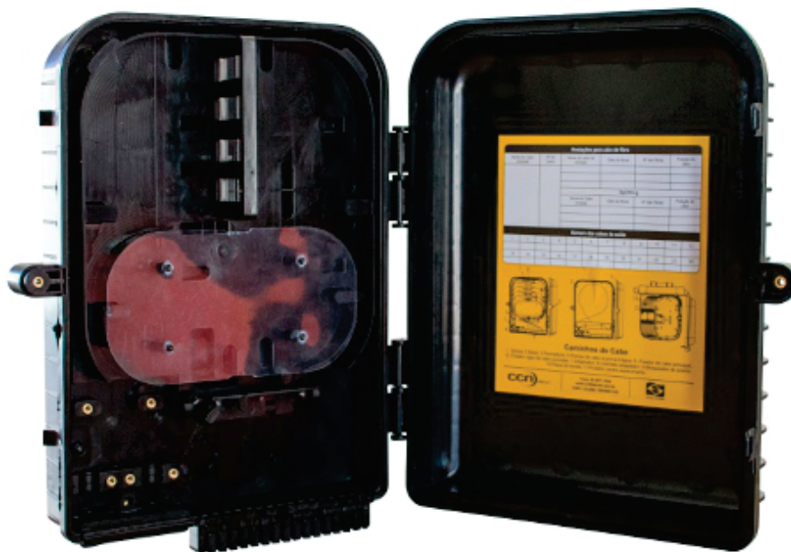
CTO - Caixa de Terminação Óptica