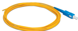
XFE 1 Extensão óptica SC/UPC SM