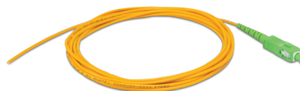
XFE 2 Extensão óptica SC/APC SM