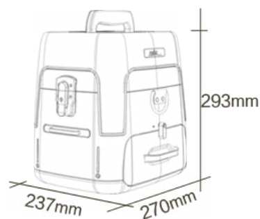
Caixa 7,1 kg